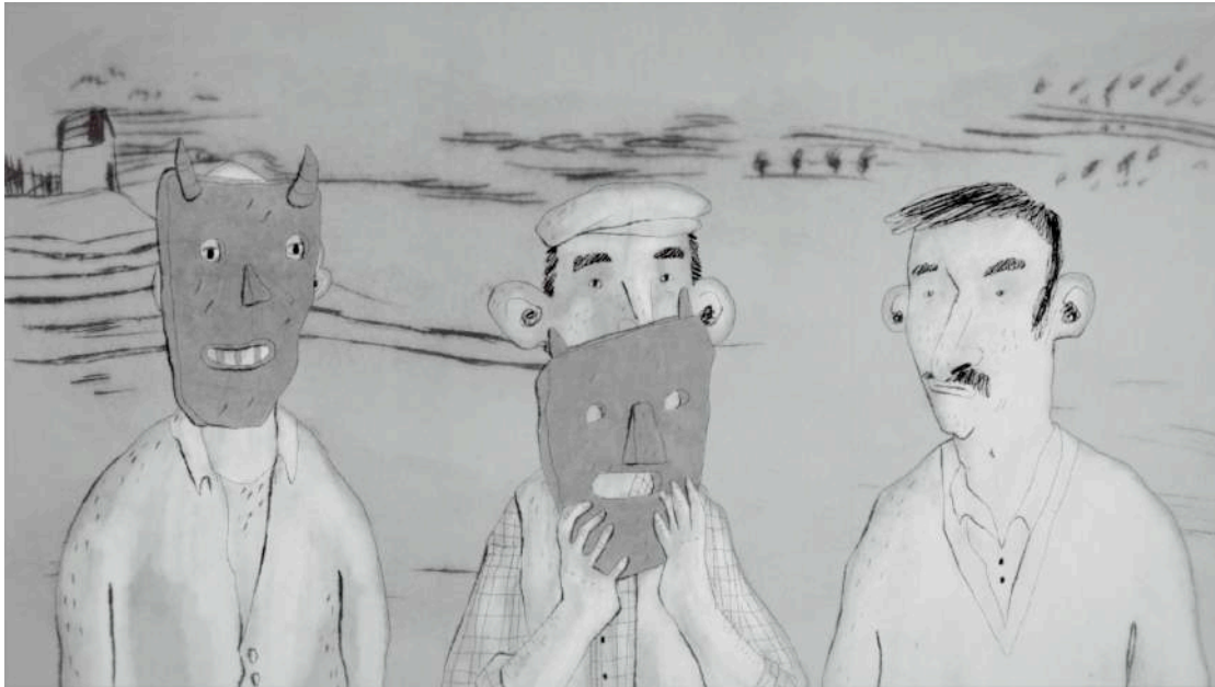
Água Mole, d'Alexandra Ramires i Laura Gonçalves, 2017, 9', Portugal

Els últims habitants d'un poble es neguen a deixar-se caure en l'oblit. En un món on la idea de progrés sembla ser, sobretot, aquesta casa flotant.