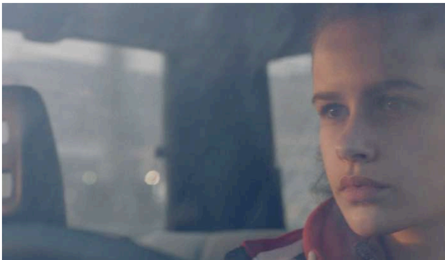
ARIA , de Myrsini Aristidou, 2017, 13', Grècia

Macha condueix entre la neu, quan sent un colp en el capó del cotxe. És Mo, el seu fill de 17 anys amb el qual havia trencat tota relació. Entre les muntanyes, el fill i la mare fan el seu últim viatge junts. Eixe dia, Mo ingressarà com a soldat en l'exèrcit francès.